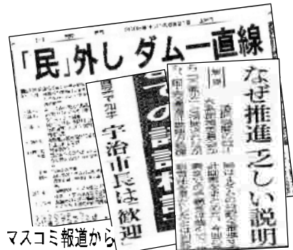
マスコミ報道から

流域委は「憤りを感じると記者会見、京都府知事は計画案の評価は「明言せず」（京都新聞）の慎重な表現。