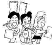
国保世帯：H18年度平均世帯数